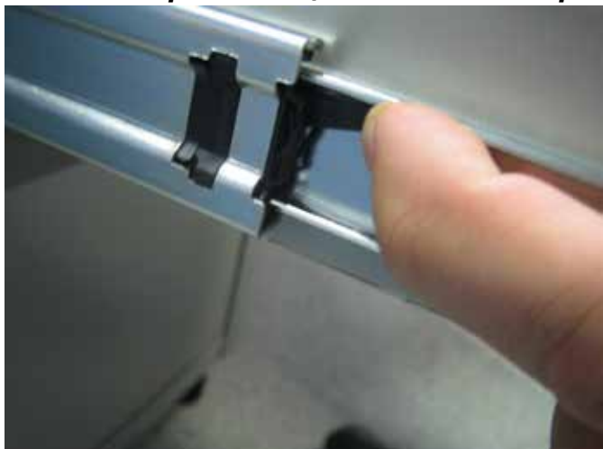
Левая направляющая - язычок вверх